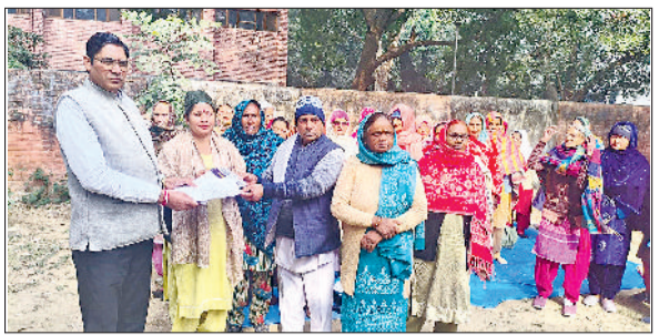
सोनीपत। राष्ट्रपति के नाम ज्ञापन सौंपते हुए सीपीआईएम जिला सचिव साथ में प्रदर्शनकारी।

प्रतियोगिताओं के विवरण पर नजर डालें तो राजकीय विद्यालयों के कक्षा 9वीं से 12वीं तक के विद्यार्थी अपनी प्रतिभा का प्रदर्शन करेंगे। निबंध लेखन प्रतियोगिता के प्रति विद्यार्थियों में भारी उत्साह देखा जा रहा है जिसमें संवैधिक 59 प्रतिभागियों ने नामांकन कराया है। वहीं भाषण प्रतियोगिता में 27 विद्यार्थी अपने ओजस्वी विचारों से मतदान के महत्व पर प्रकाश डालेंगे और प्रश्नोत्तरी प्रतियोगिता में 17 विद्यार्थी चुनावी प्रक्रिया से जुड़े अपने ज्ञान की परीक्षा देंगे।