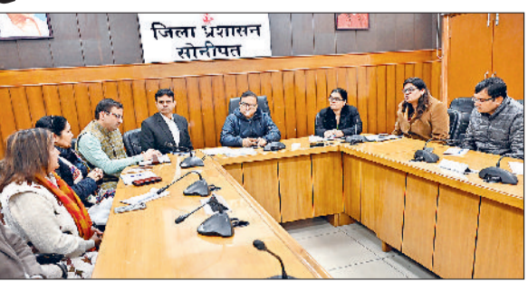
सोनीपत। बैठक के दौरान मौजूद अधिकारी साथ में भाजपा पदाधिकारी।

भारत रत्न, पूर्व प्रधानमंत्री अटल बिहारी वाजपेयी की 101वीं जयंती को जिला प्रशासन द्वारा अटल स्मृति दिवस के रूप में भव्य एवं गरिमापूर्ण ढंग से मनाया जाएगा। उन्होंने बताया कि 25 दिसंबर को उनकी जयंती के अवसर पर जिले के सभी शिक्षण